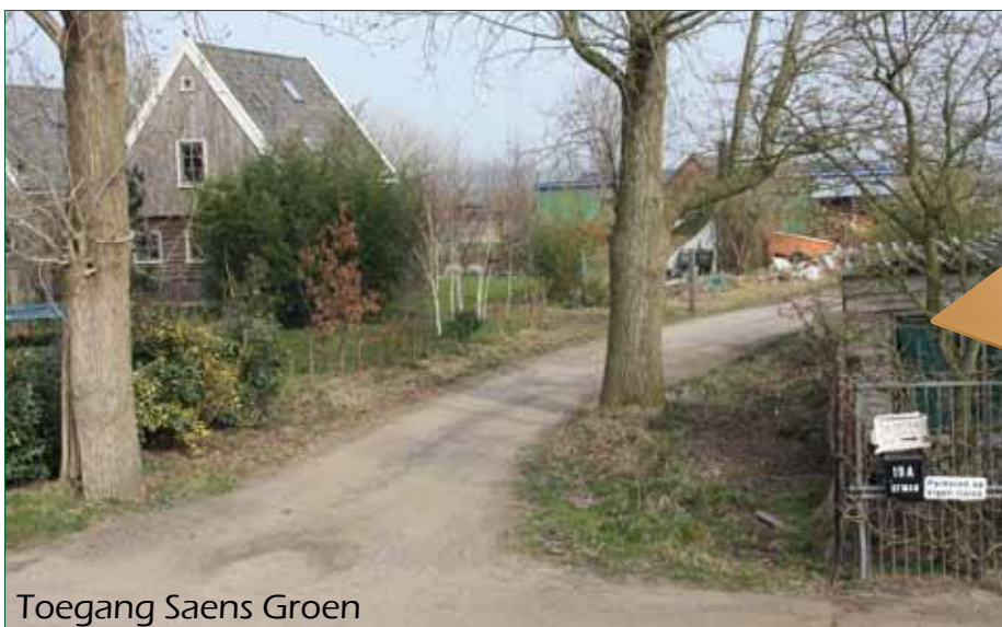
Toegang Saens Groen