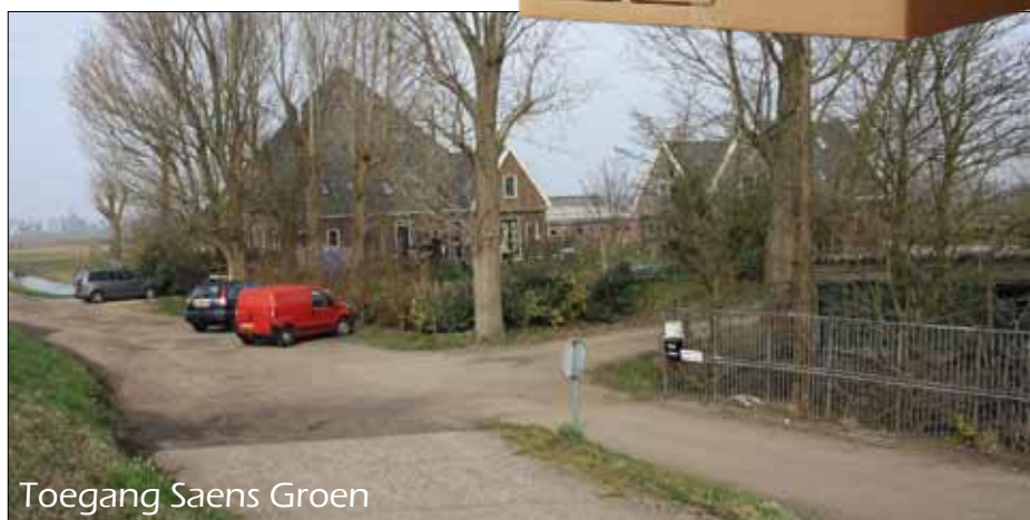
Toegang Saens Groen